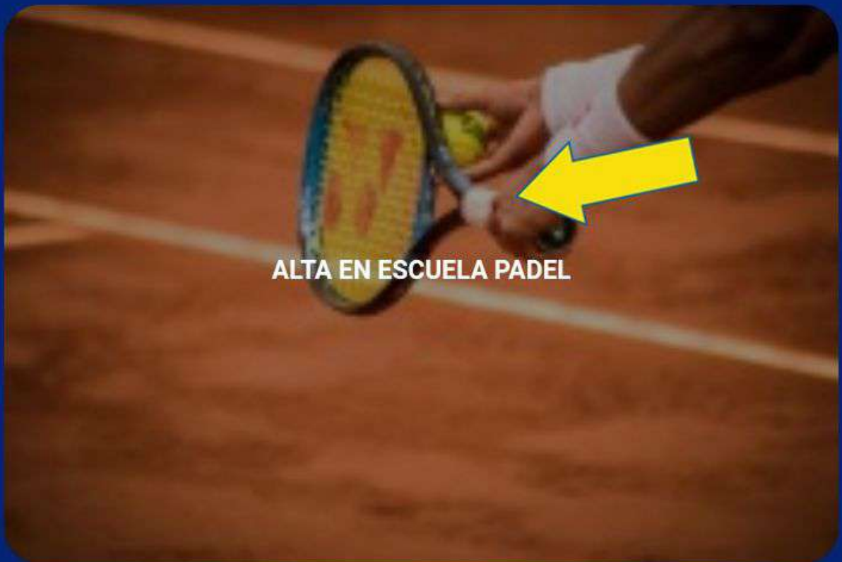
ALTA EN ESCUELA PADEL