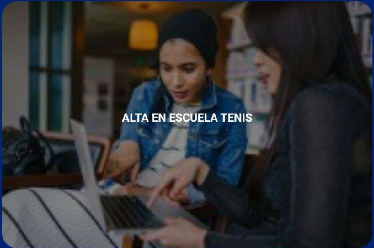
ALTA EN ESCUELA TENIS